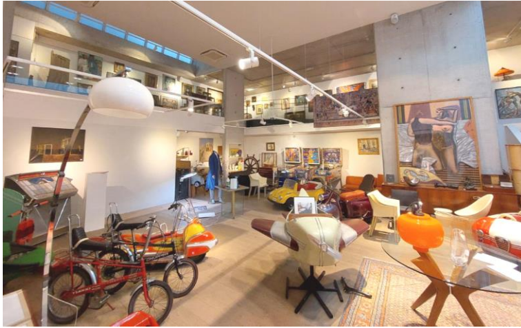
1. Immeuble commercial